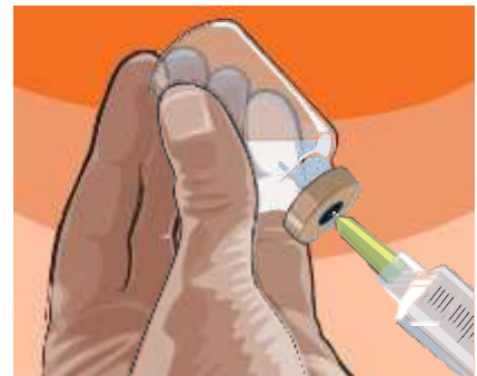
4.4 Vaihe 5: Ota tarvittava määrä käyttövalmista injektioliuosta hitaasti ruiskuun kustakin injektiopullostta