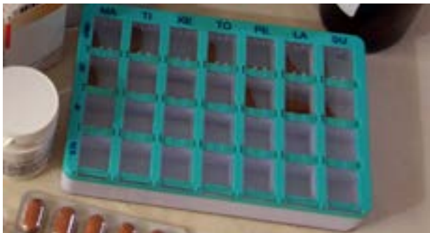
Dosetti eli annostelija.

Jos sinulla on paljon lääkkeitä, voit käyttää annostelijaa eli dosettia.