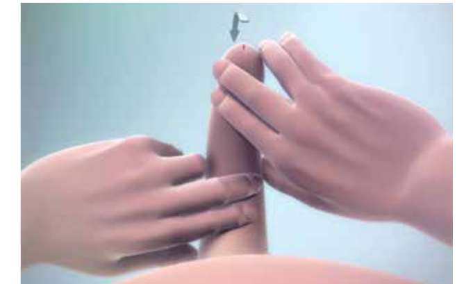
Ylhäältä kuvattuna siittimen suoristus, joka tehdään korkeintaan kerran päivässä, jos seksuaaliseen aktiivisuuteen liittymätön spontaani erektio esiintyy.

Venytysliike tulee tehdä päivittäin kolme kertaa päivässä lepotilassa olevalle siittimelle.