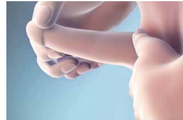
Sivulta kuvattuna siittimen venytys, joka tehdään kolme kertaa päivässä.

parhaasta ajankohdasta suorittaa nämä toimenpiteet. Potilaat tekevät näitä harjoituksia noin 6 viikkoa jokaisen hoitojakson jälkeen.