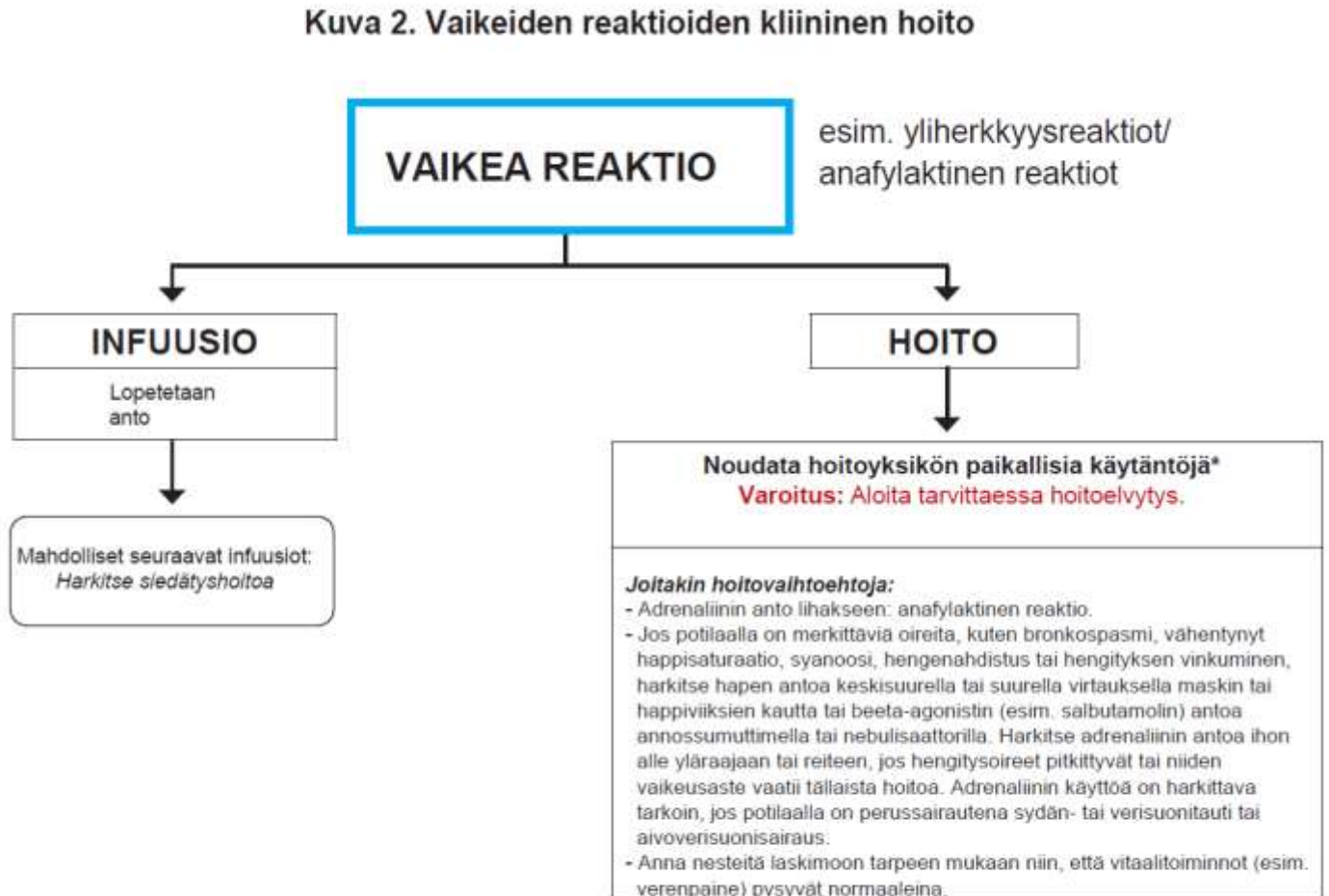
Kuva 2. Vaikeiden reaktioiden kliininen hoito

*Vasta-aiheet on aina suhteutettava hyötyyn tai tarpeeseen käyttää adrenaliinia hengen pelastavana hoitona hengenvaarallisten anafylaktisten reaktioiden yhteydessä.